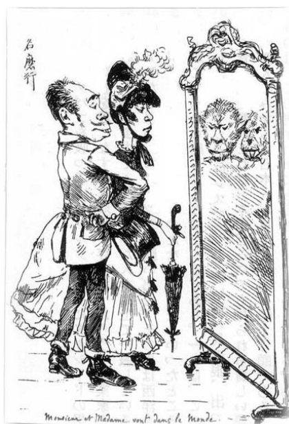
(ビゴー筆 川崎市市民ミュージアム蔵)